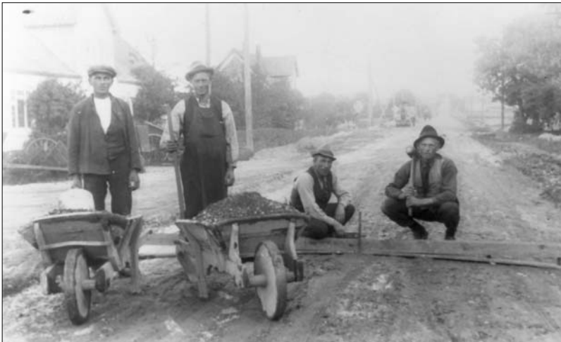
Vejfolkene brugte skabelonen til at sikre vejens rette krumning

I 1919 forlod jeg landbruget og kom til amtet, og der var jeg ved en tromle det efterår. Om vinteren var vi to mænd, der kom til at gå og grave store sten op nede ved Vangs hovedgård oppe i Vendsyssel. Der var et stendige, der var knap to kilometer langt. Det var ene store sten, der skulle slås og skydes, vi gik og gravede ud der. Der foregik med nogle stålstænger og hvad vi kunne bakse dem op med. Så havde vi hamre til at slå dem i stykker. Dem, vi ikke kunne slå i stykker, skød vi med aerolit. Amtet købte så en stenknuser med motor, og vi to mænd der var der kom så til at arbejde sammen i to år med det knusen sten. Det var meget lettere arbejde efter vi fik den maskine.