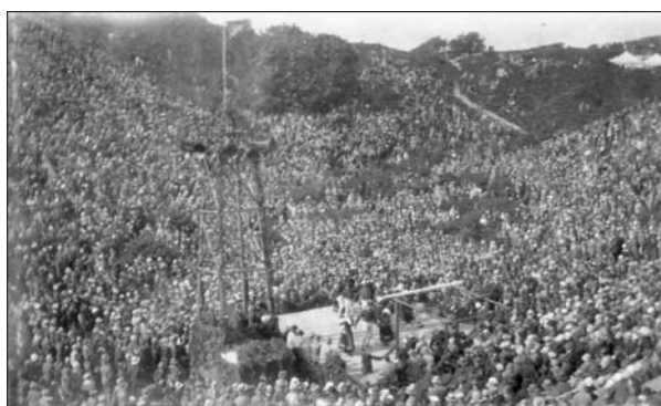
Rebildfest – her fra 1928