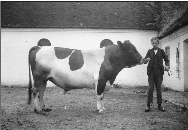
Tyr i stil med "Hæsum Matador"

At kalde en tyr "Hæsum Matador" vil måske synes én, med kun minimalt kendskab til vendinger brugt mellem tyrefægtere, at være et dårligt valg. "El Matador" er den tyrefægter, som dræber tyren i ringen. Ordet kommer fra det spanske "matar" = at dræbe. Tillagt "dor" betyder det dræberen. I den forbindelse forventer man, at det er tyren, der bliver dræbt. Jeg kan give forsikringer om at "Hæsum Matador" havde både styrken og viljen til at dræbe, og ved én lejlighed var jeg nær blevet hans offer.