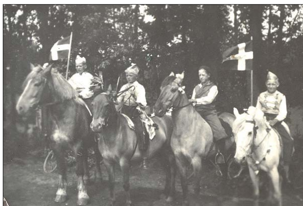
Børn fra Hæsum klar til ringridning

Efter middagshvilet reparerede jeg mit og hestens tynde udstyr, som havde lidt en del skade under morgenens begivenheder. Jeg sadlede op og begav mig til samlingspladsen med fanen vajende. Kolonnen var nu blevet øget med tre musikere i en jumbe, og vi var nu rede for vort omtøgt. Jeg tog min plads forrest i kolonnen med fanen, og kongen og prinsen fulgte næst efter. Derefter kom resten af deltagerne i to-kolonne med musikken sidst, blæsende på deres horn af deres lungers fulde kraft. Det var festligt.