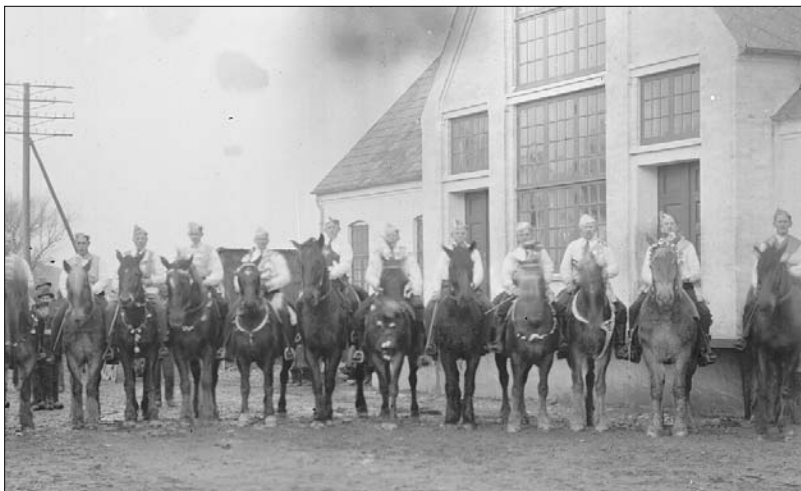
Klar til ringridning. Billedet er fra Øster Hornum.