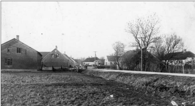
Grøfter langs vejen i begge sider

Kun Fattighuset, der nu kaldtes Kommunehuset, er uforandret af udseende, men nu fungerede som udlejningsejendom.