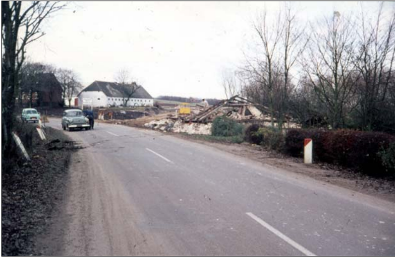
Kommunehuset rages ned

Set med nutidens øjne undres man over, at en snoet indkørsel til en by blev rettet ud, så der kunne køres hurtigere ind i byen, men sådan så man ikke på den sag i slutningen af 1960'erne, hvor alt skulle strømlines.