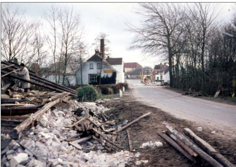
Kommunehuset rages ned

Der var stort gravearbejde i området ved Svanedammen, hvor vejen blev udvidet i den vestre side, hvilket gik ud over en del af dammen, der lå som en del af præstegårdens have.