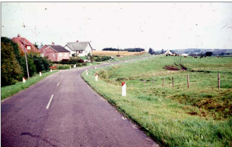
På vej mod Nibe ad den gamle vej

Billedet her er taget efter Forsamlingshuset, der ses til venstre i billedet, blev bygget i 1907 og før 1925, hvor der kom elektrisk lys og kraft til byen, og master til elledninger blev rejst på vejens vestside.