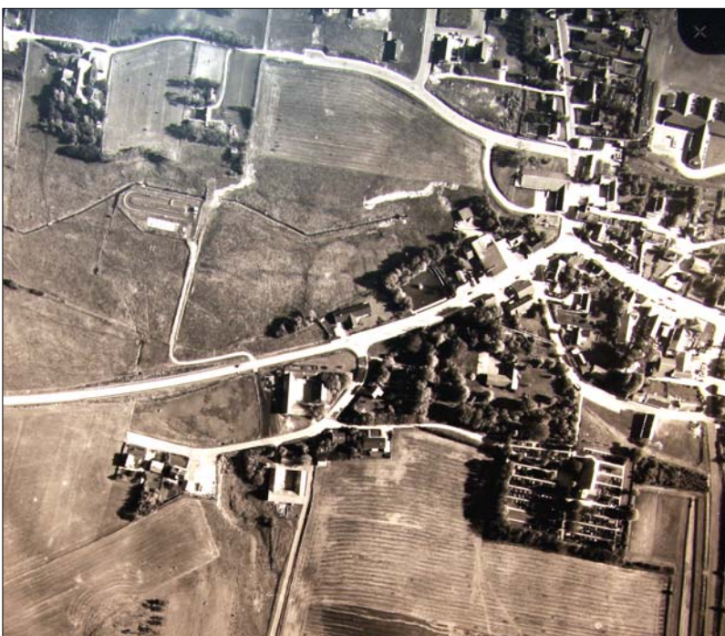
Luftfoto 1975 – vejen mod Nibe til venstre

Her ses arbejdet under udførelse i byens sydlige udkant.