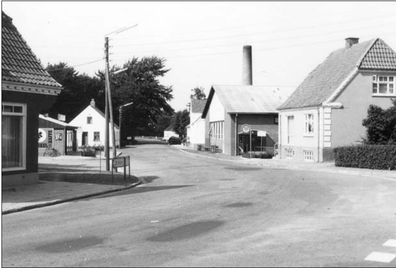
Nibevej mod nord omkring 1965

Der er ikke sket noget med vejforløbet i de forløbne år, men bygningerne er væsentligt forandrede. Den gamle Brugs blev raget ned i 1964 og den nuværende bygget.