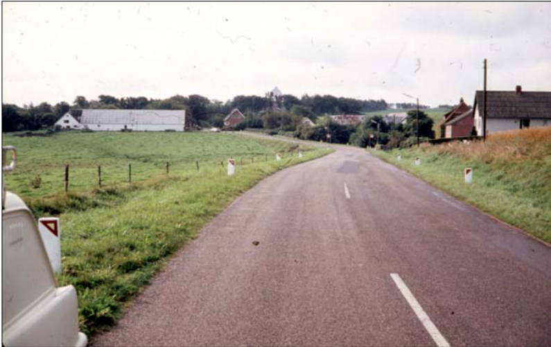
Ind mod byen ad den gamle vej

Kom man derimod fra Nibe, mødte man byen på denne måde, idet vejen passerede vest om gården, der ses i venstre side af billedet.