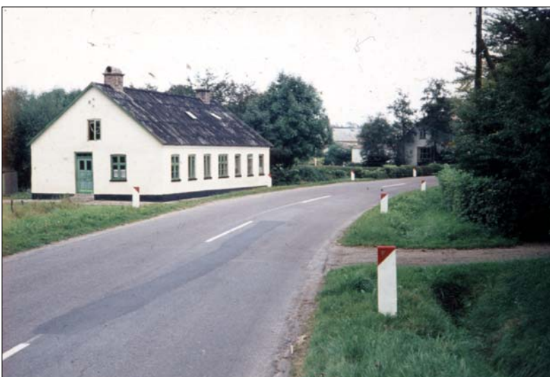
Kommunehuset ved byens nordlige udkant