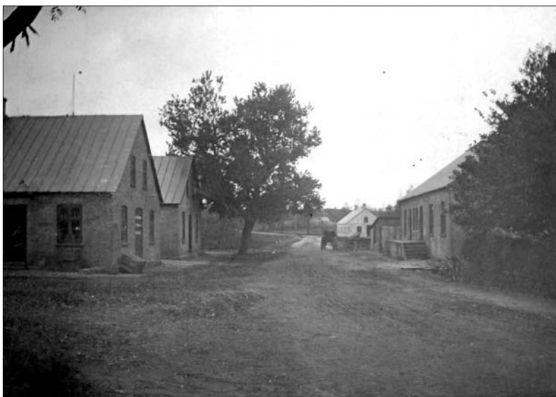
Nibevej mod nord i begyndelsen af 1900-tallet

Dog lå der frem til 1920'erne stadig et hus temmelig langt fremme i hvad der nu er byens centrale kryds, hvor Guldbækvej munder ud i Nibevej.