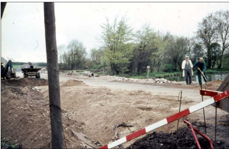
Stort gravearbejde ved Svanedammen

Kommunehuset ses under nedbrydning, og den ny vejføring øst om gården er ved at tage form.