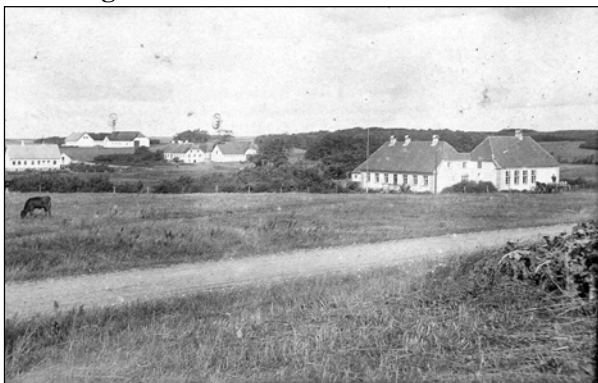
Guldbæk i 1920'erne