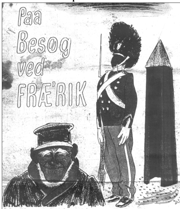
Politikens tegning af besøget hos Fræ'rik