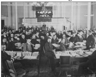
Folketingssalen i Fredericia-gade 1884 til 1918