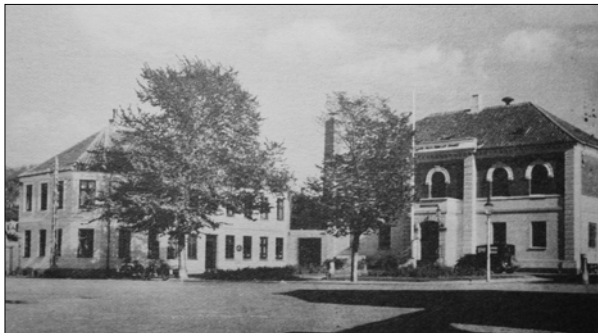
Torvet i Nibe med rådhuset til højre