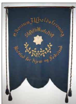
Øster Hornum afholdssforenings fane