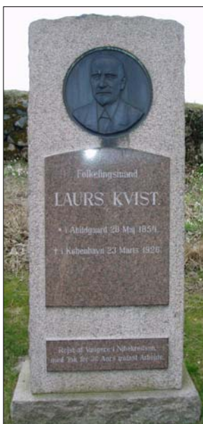
Rejst af Vælgere i Nibekredsen med Tak for 36 Aars trofast Arbejde