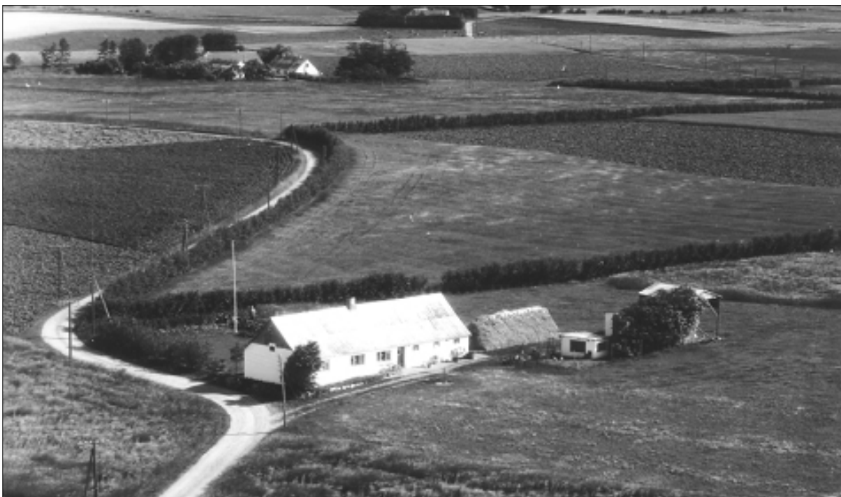
Hjemmet på Harrildhusvej i Byrsted, formentlig i 1950'erne