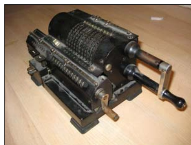
Den første regnemaskine, kaldet en "svinger-regnemaskine" på Øster Hornum Kommunkontor