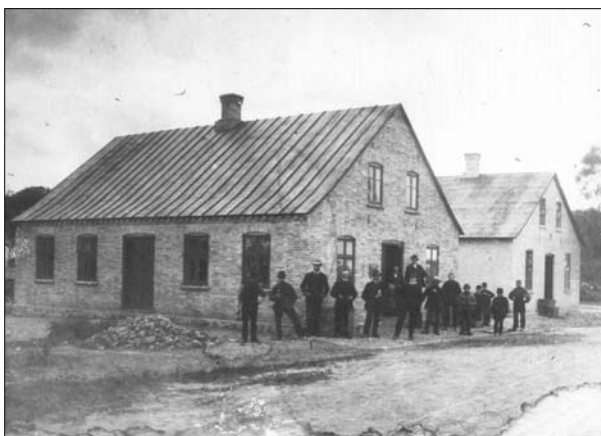
Den nybyggede Øster Hornum Brugsforening