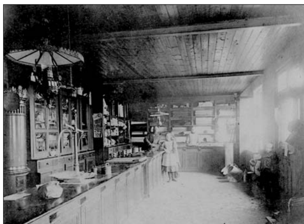
... og her indefra