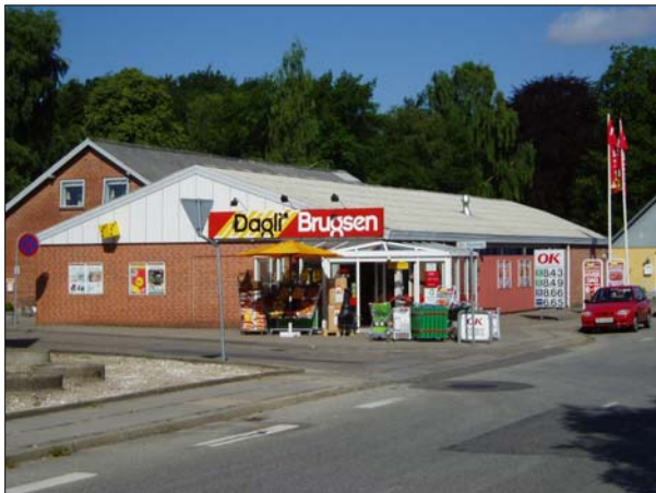
Dagli' Brugsen 2004