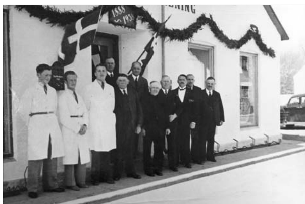
Ansatte og bestyrelse på jubilæumsdagen 1938

Allerede i efteråret 1933 byggedes et nyt pakhuis. I 1934 meldtes om stigende omsætning og i 1935 indlagdes vand fra det nyetablerede vandværk i byen. Op gennem 1930'erne fortsatte den økonomiske optur for foreningen og bestyrelsen puslede med tanker om en gennemgribende ombygning og modernisering af butikken. Man indkaldte en arkitekt fra FDB, men planerne faldt med et brag på generalforsamlingen. Bestyrelsen blev bemyndiget til at foretage de nødvendige reparationer og der lappedes videre på de gamle bygninger med udrapning og kalkning af murene, lapning af tjæretaget og maling af døre og vinduer.