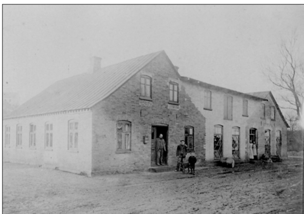
Brugsen lige efter udvidelsen, her set udefra

Da brugsforeningen byggede i 1889 troede alle, at omsætningen vanskeligt ville nå en årlig omsætning af 30.000 kr. Men omsætningen kom snart til at overstige dette beløb, og huset blev for lille. Allerede 1896 måtte butikken ombygges, således at indgangen blev på sydsiden af huset. Noget af beboelsen toges med til butikken. Dette gav nogen plads for en tid, men pladsen var stadig for lille. Det gik nu en halv snes år, men i slutningen af 1906 toges spørgsmålet om mere plads under alvorlig overvejelse. På generalforsamlingen i september gaves bestyrelsen pålæg om at søge forhandling med samlingshuset for om muligt at købe dette. Det var omtrent den eneste udvej til at få plads. I oktober rettedes henvendelse til bestyrelsen for samlingshuset, og dennes svar kom i slutningen af november. De ville sælge og forlangte 3200 kr. for samlingshuset. Brugsforeningen holdt generalforsamling den 10. december, og på denne vedtoges med 59 ja mod 21 nej at købe samlingshuset til nævnte pris. Allerede den 17. december holdtes igen generalforsamling, og på denne forelå to forslag. Det første gik ud på at sammenbygge begge huse og det andet på at lave butik i samlingshuset. Det første vedtoges og samme sommer udførtes arbejdet. Det blev særdeles rimelige lokaler, og der er nu ingen frygt for, at de igen skal blive for små.