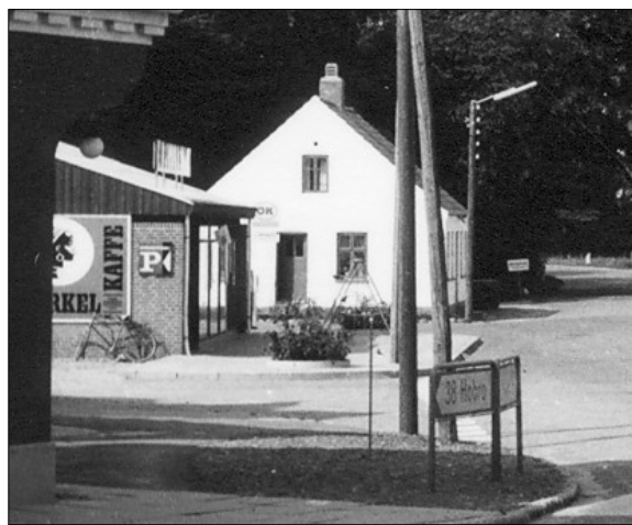
Brugsen efter ombygningen i 1964

I perioden efter den gamle Brugs var lukket og til den ny Brugs var bygget og klar til indvielse måtte salget foregå fra en del af lageret. Det var knebent med plads og meget svært for kunder og personale at få tingene til at fungere på en fornuftig måde, men man kæmpede sig igennem perioden fra begyndelsen af juni til midt i november, hvor den ny butik stod klar. Ombygningstiden var temmelig belastende for uddeler og personale, idet der skete en del tyverier fra den mere eller mindre frit tilgængelige butik. Tabet ved tyveri og svind i øvrigt måtte uddeleren på den tid klare af egen lomme. Et tab der i perioder var meget føleligt og gjorde ansættelsesforholdet belastende. Tyverierne forsøgte man at komme til livs ved i en periode at holde nattevagt i butikken, men det gav ikke noget resultat.