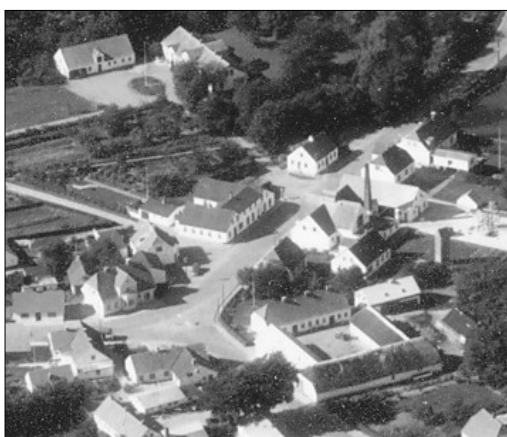
Før pakhuset blev bygget 1956

I efteråret 1946 var der planer om kloakering i Øster Hornum. Det fik Brugsens bestyrelse til at få en landmåler til at fastlægge skellet over til præstegården. Det blev vedtaget at gå med i kloakeringsprojektet med et bidrag på knap 3000 kr. – et beløb der voksede til 3500 kr. efter kloakeringen var udført.