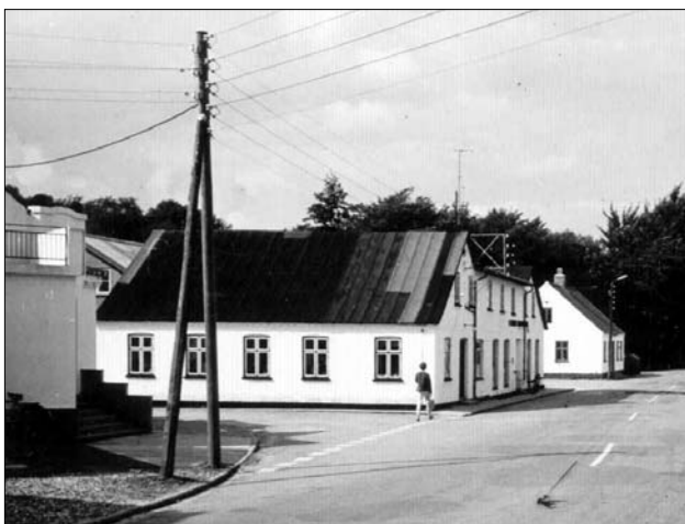
Brugsen ca. 1960